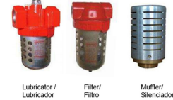
Lubricator / Lubricador Filter / Filtro Muffler / Silenciador